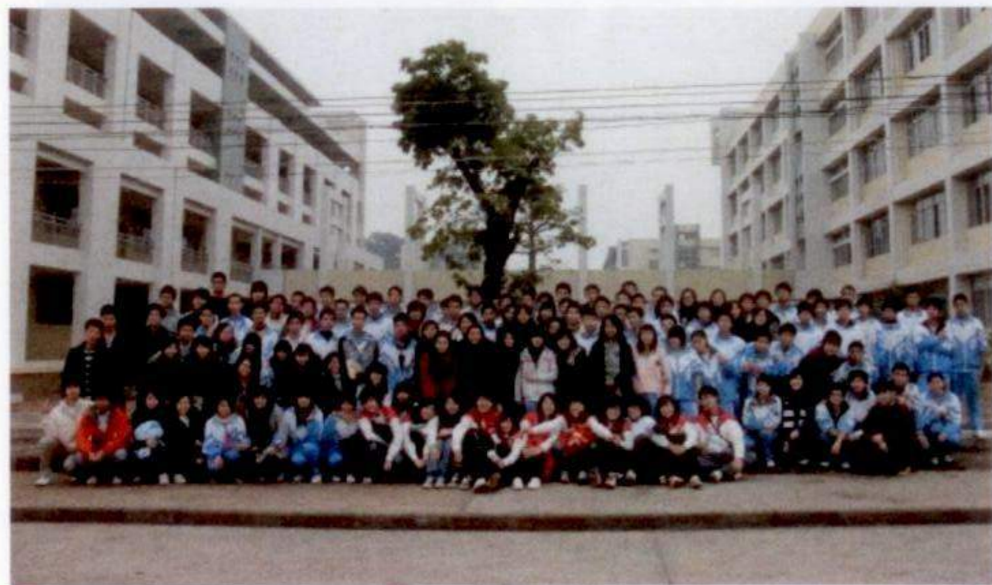
第十五屆幹事成員、冬季團團友及懷集高中學生大合照

總結八日行程，時間雖短，但只要撒下關注內地山區教育的種子，未來山區學生讀書之路將會更平坦、更寬闊。