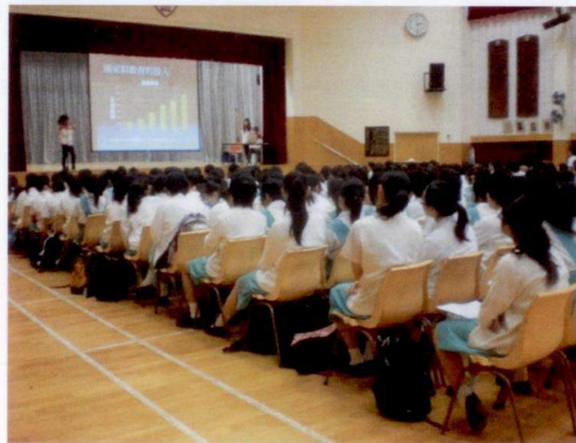
二零零九年十月，中國教育小組於庇理羅士女子中學舉行學生講座

綜合來說，本年度學生計劃雖然困難重重，但都成功舉辦了四次學校講座，向學生剖析中國教育現存問題，引起學生反思教育的意義及明白其中的重要性，更重要的是，於學生心中植下改變中國教育問題的種子。