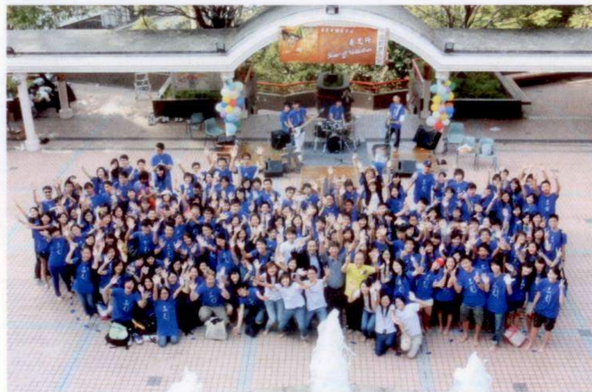
二零零九年十一月赤足行開幕典禮

其中赤足行是小組最大型的籌款活動。「上學去」是不少內地山區學生的夢想，但他們求學的路途如赤著足在山路行走般艱難。他們的學習路上除了要面對國內激烈的考試競爭和生活的困迫，還要面對性別歧視、貪污等種種社會問題。於零九年十一月舉行的赤足行中，二百名參加者以赤足步行的方式由港大步行至山頂廣場，為內地高中學生籌得三萬六千元善款。此活動的一切開資亦由贊助商慷慨資助。赤足行讓參加者了解中國內地的教育問題，並讓他們體驗到內地學生們求學的毅力與堅持。除了本地學生的支持，議員梁家傑、湯家驊和馮檢基亦擔任了是次活動開幕禮嘉賓，身體力行赤足籌款，一同為山區學生盡一分力。