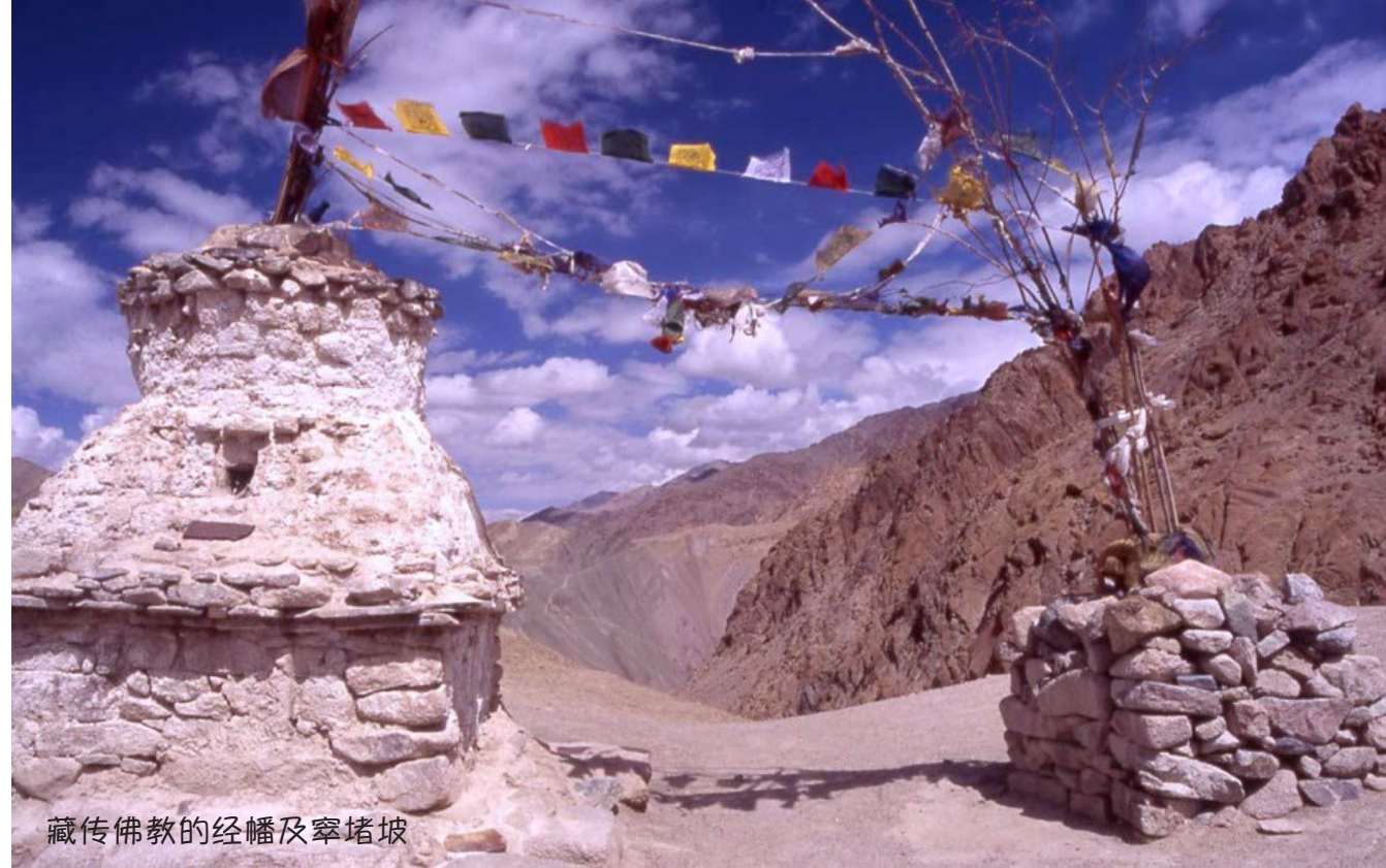
藏传佛教的经幡及窣堵坡