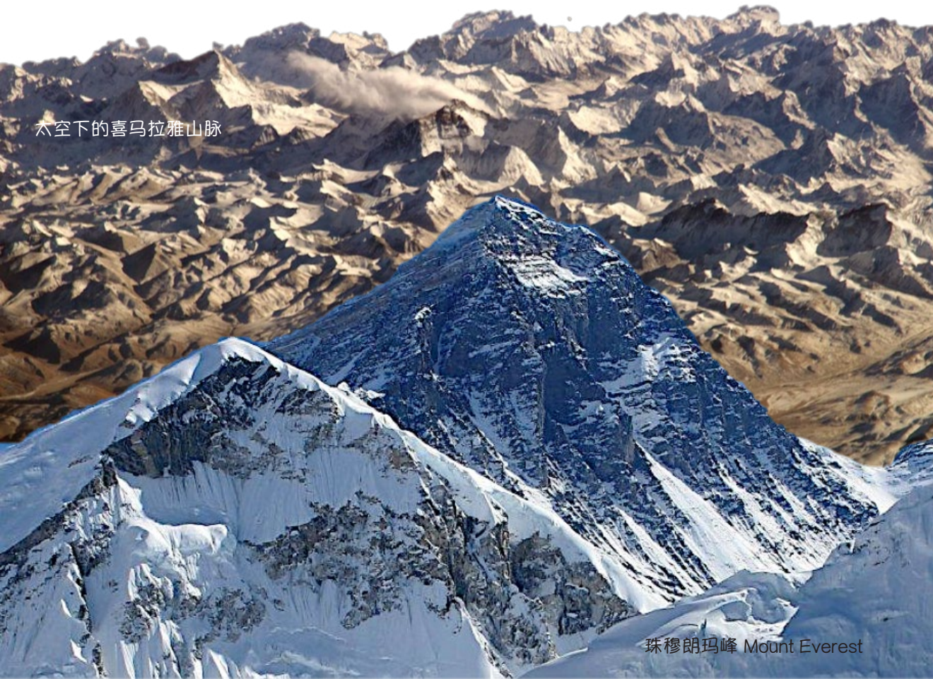
珠穆朗玛峰 Mount Everest